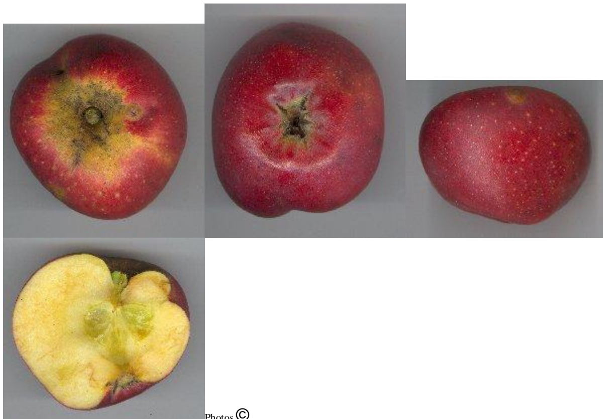
Choisel jean-louis, 2005.